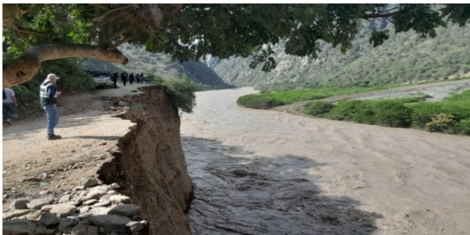
FIGURA N°03: EN EL FINAL DEL TRAMO DEL RIO HA AFECTADO UNA CARRETERA LA CUAL SE ENCUENTRA TOTALMENTE DESTRUIDA.