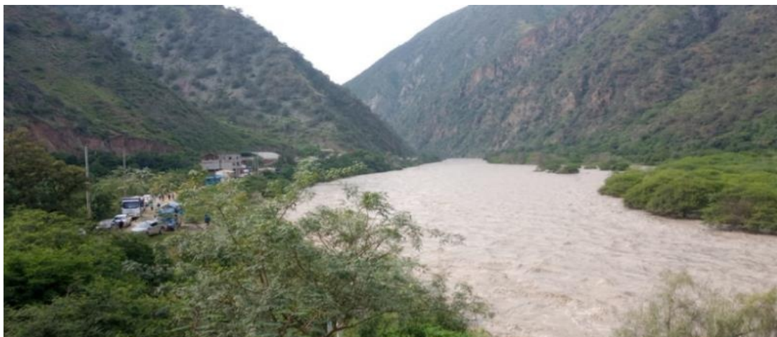
FIGURA N°01: RECORRIDO E IDENTIFICACION DE TRAMOS CRÍTICOS DESDE EL PUNTO DE INICIO, DONDE SE PUEDE VISUALIZAR QUE EL RIO EN SU MAREGEN DERECHA AFECTADO A VIVIENDAS Y PARTE DE LA CARRETERA DESTRUIDA.