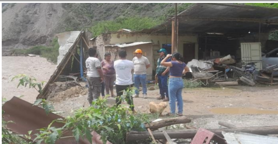
FIGURA N°02: EN EL RECORRIDO SE OBSERVA QUE EL RIO, EN SU MARGEN DERECHA VIENE AFECTANDO VIVIENDAS Y PARTE DE LA CARRETERA TOTALMENTE DESTRUIDA